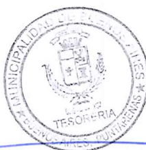
Esteban Fallas Vidal Tesorero Municipal a.i